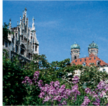
1_ Prunksaal in der Residenz 2_ Marienhof und Frauenkirche mit den zwei markanten Türmen