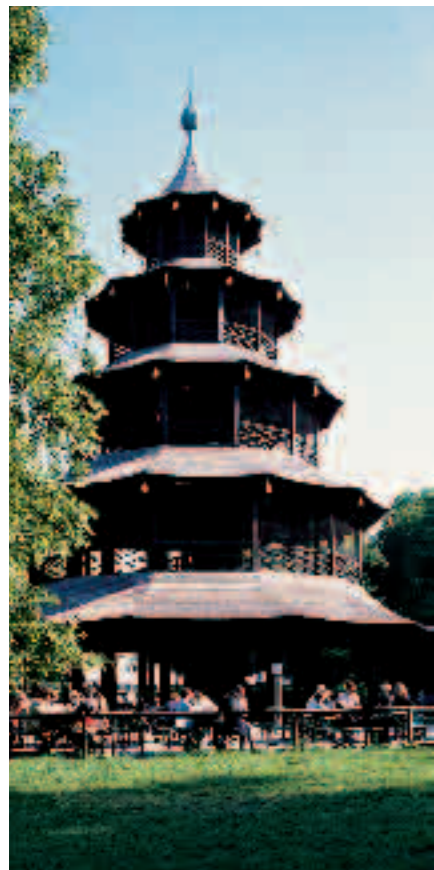
2_ Schwabing träumt: Chinesischer Turm im Englischen Garten

a nfang des letzten Jahrhunderts galt Schwabing als die ultimative Künstlerkolonie, als das Montmartre Deutschlands. In den Cafés, Kneipen und Bars gaben sich Klee, Kandinsky, Brecht, Rilke, Lenin, Zuckmayer, Mann, Ringelnatz und Horváth die Klinke in die Hand, und die schillernde Ober-Bohemienne Franziska zu Reventlow resümierte für ein und alle Zeiten: „Schwabing ist kein Ort, sondern ein Zustand.“