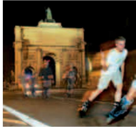
1_ Schwabing lebt: Skater auf der Ludwigstraße vorm Siegestor