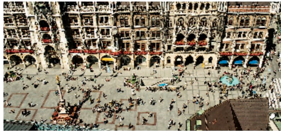
1_ Wittelsbacherbrunnen, Residenz 2_ Blick auf den Marienplatz vom Turm der Peterskirche