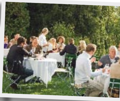
DRINNEN & DRAUSSEN Plaudern während der Pause im Weimarer Schlosshof (links), Workshop im Seminarraum (Mitte), Lunch im Grünen (rechts)

Schranken fallen, Grüppchen finden sich und lösen sich wieder auf, alles ist in Bewegung, gelebte Metamorphose, ein Happening für Fortgeschrittene.